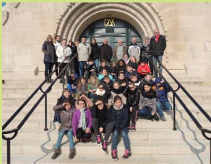
Les enfants ont gravi les 200 marches de la tour de l'ossuaire de Douaumont

Organisé par le SIVU, Les enfants du pôle scolaire René Daumal, accompagnés du personnel enseignant, des parents et des anciens combattants de la section de Boulzicourt, ont visité le fort de Vaux et le musée de Verdun, lequel vient d'être restauré.