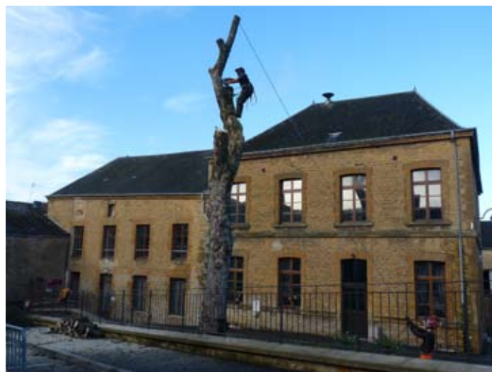
C'est avec une certaine nostalgie que la plupart d'entre-nous ont vu disparaître ce grand seigneur centenaire qui a connu tant d'évènements. Nombreux, étaient ceux de la petite enfance à jouer autour de lui. Hélas, à la fin de sa vieillesse, nous avons dû l'abatre pour sa dangerosité.