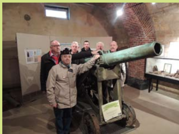
les anciens de la section posent devant un canon du fort de Vaux.