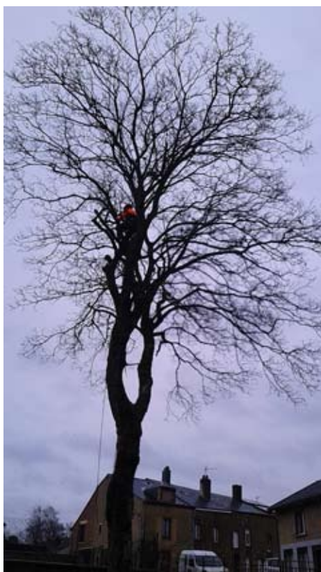
C'est une entreprise locale spécialisée dans cette activité qui a réalisé ce travail d'alpiniste en toute sécurité